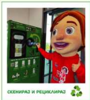
СКЕНИРАЈ И РЕЦИКЛИРАЈ