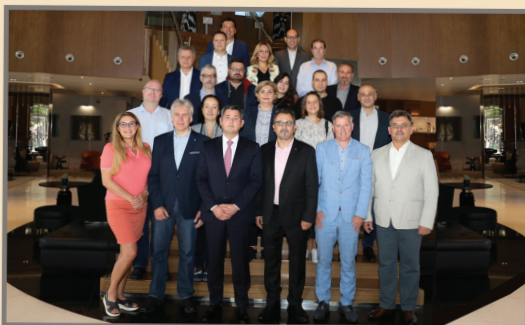
Balkan workshop 2022, Skopje

Во оваа работилница беа разменети различни искуства во поставувањето, развивањето и во функционирањето на шемата за преработка и рециклирање на отпадот од пакување.